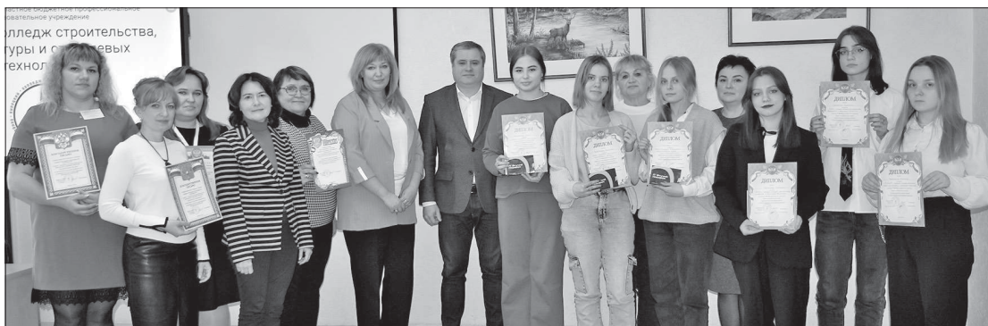
Фото на память с дипломами и грамотами

Победителей наградили дипломами и призами. Студенты Усманского промышленно-технологического колледжа получили сертификаты участников и подарки от Союза строителей Липецкой области и МУП «Зеленхоз» города Липецка.