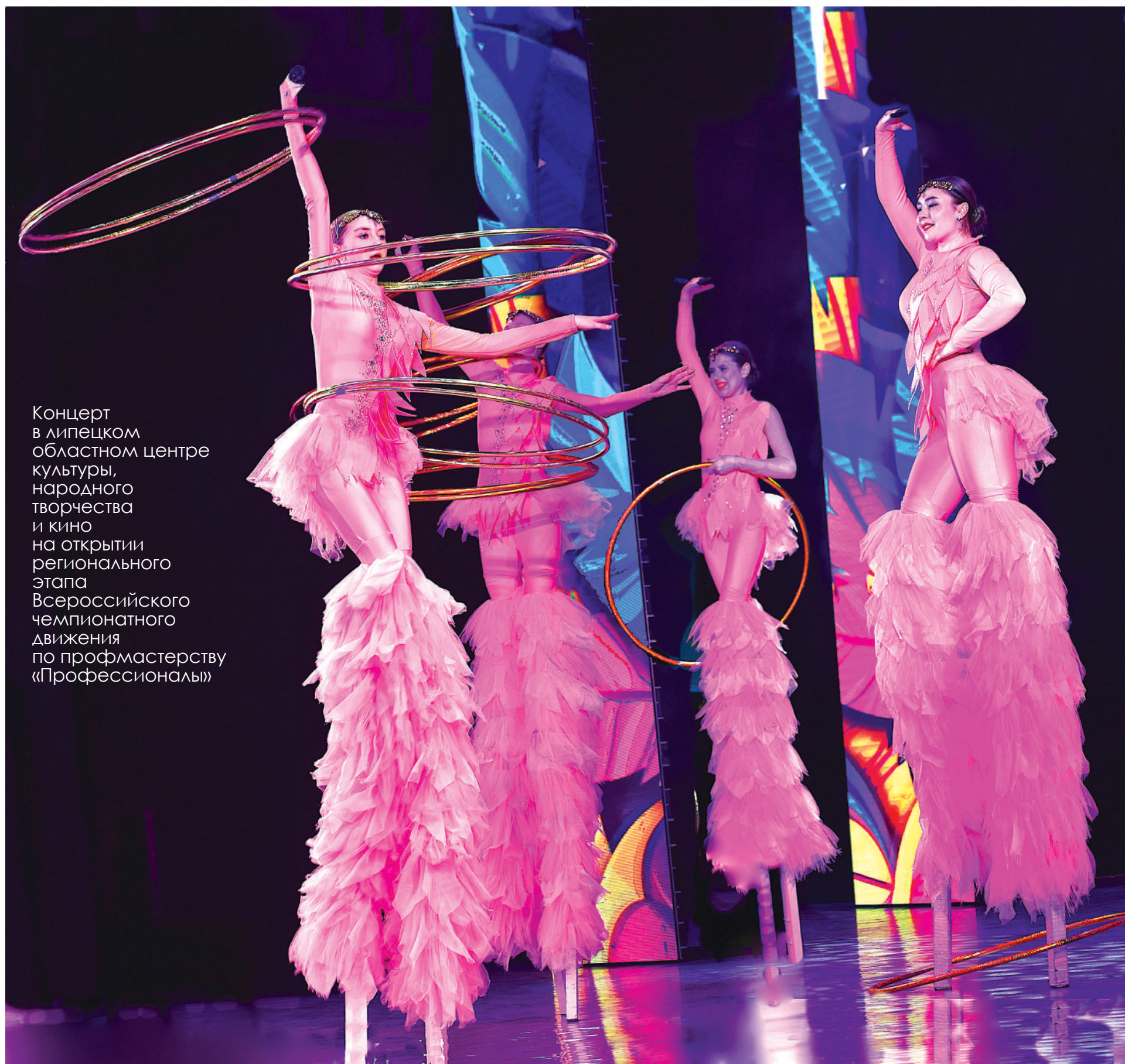
Концерт в липецком областном центре культуры, народного творчества и кино на открытии регионального этапа Всероссийского чемпионата движения по профмастерству «Профессионалы»