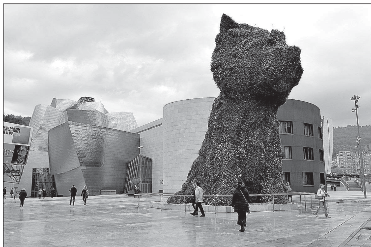
Музей в Бильбао. Озеленённый Щенок Д. Кунса

В 2014 году на окраине Булонского леса в Париже вступил в строй долгожданный Музей современного искусства Фонда Луи Виттона. Это общественно-культурный центр с занимающими лишь треть объёма здания одиннадцатью выставочными пространствами и трансформируемым универсальным зрительным залом на 360 мест.