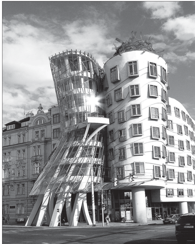
Танцующий дом в Праге

Не трудно догадаться, что более массивный из двух ци-