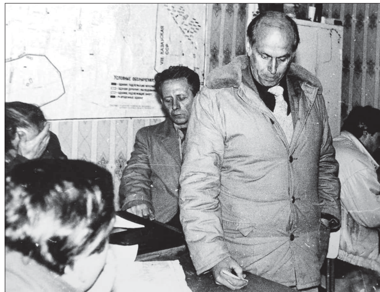
Приходилось принимать очень трудные решения